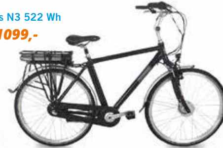
Fongers Basic Plus N3 522 Wh € 1.699,- nu € 1099,-