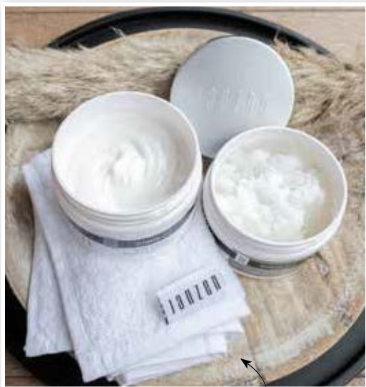
Fijne verzorgende producten uit de Janzen-collectie

De zomer komt eraan en dat betekent dat jouw huid een verwenmomentje verdient. Gun jezelf én een ander een moment van ontspanning, geluk en positiviteit en laat je huid stralen! Wil je dit fijne en vrolijke gevoel ook naar binnen halen? Dat kan met JANZEN.